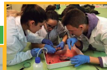
Laboratorio de Ciencias